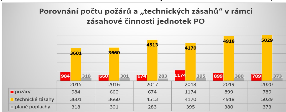
Graf č. 1 – porovnání počtu požárů a „technických zásahů“ - rok 2020 je statisticky promítnut pouze do 15.11.2020

Během uplynulých 20 let pokračuje trend započatý v závěru minulého století, pokračuje změna poměru zásahů souvisejících s bojem s požáry a tzv. ostatních technických zásahů, kdy boj s požáry v rámci činností prováděných jednotkami PO při řešení MU na území Libereckého kraje má stále klesající tendence, a to z pohledu podílu na celkové skladbě zásahové činnosti jednotek PO, ale i ve vztahu k právě